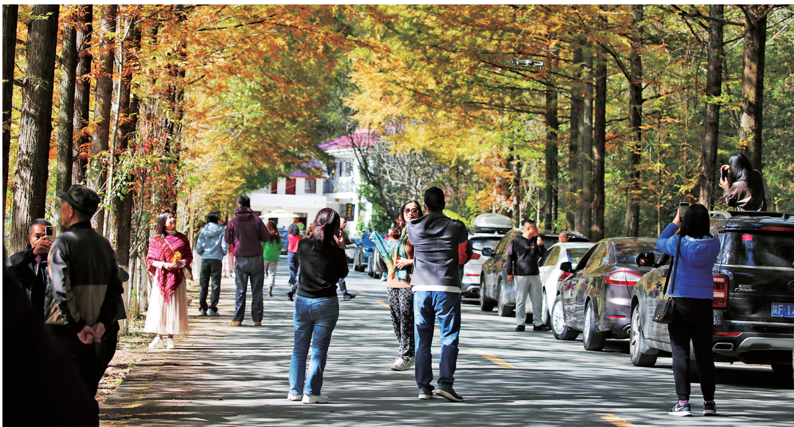
时下,留坝县红叶最佳观赏季悄然而至,紫柏山国家森林公园、狮子沟牧场、千年银杏谷、最美乡村公路等景点成了游客赏秋热门打卡地。这是游客在最美乡村公路高江路上赏景、拍照。

本报讯(记者 李佩蓉)近日,我市农村寄递物流体系建设工作领导小组印发《汉中市推进农村寄递物流体系建设实施方案(2024-2025年)》(以下简称《实施方案》)。旨在进一步提高全市农村寄递物流体系建设成效,提升农村寄递物流服务水平。《实施方案》明确,到2024年底,除建制村快递服务覆盖率达到100%的企业以外,其余主要快递品牌快递服务覆盖率达到90%以上,80%的建制村建成寄递物流综合服务站,农村邮政段道实现100%汽车化配置投递。到2025年,主要快递品牌实现村级寄递服务基本全覆盖,更好满足乡村产业振兴和农村居民生产生活需要。《实施方案》要求,开展农村寄递物流体系基础设施普查,明确县级寄递公共配送中心、乡镇服务站、村级服务点分布情况,合理部署邮